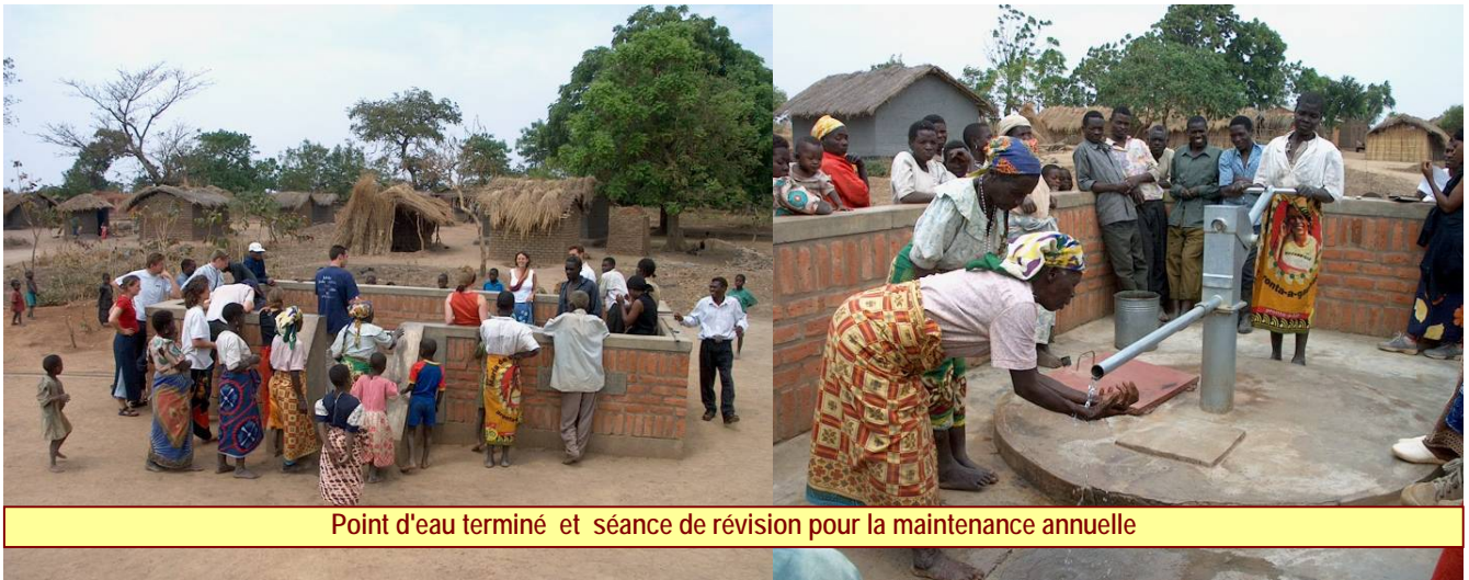
Point d'eau terminé et séance de révision pour la maintenance annuelle