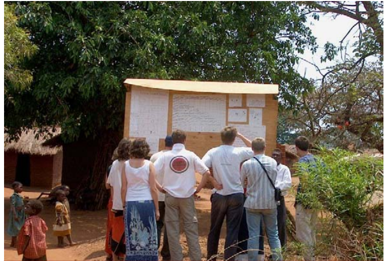
Methode PHAST : panneau présentoir des résultats de l'étude