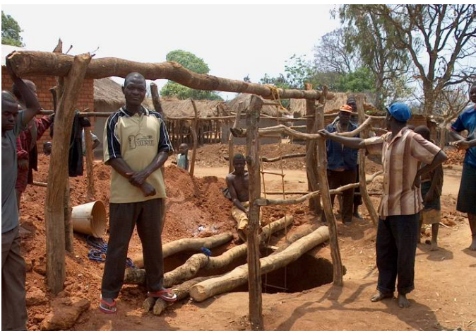
Puits en phase de creusage par les villageois

reprenant des informations, actualisées quotidiennement, sur les projets en cours : le type de projet (qu'il s'agisse de réhabilitation, de